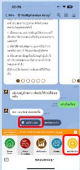
1 กดปุ่ม แจ้งเรื่องใหม่ แล้ว กดปุ่ม แชร์ตำแหน่ง ที่ต้องการแจ้ง