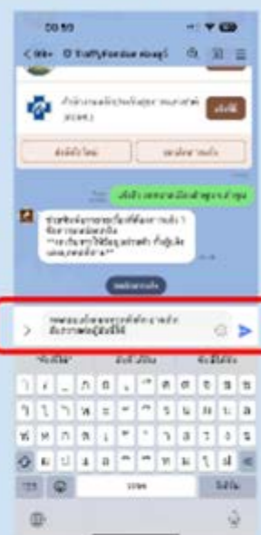
3 พิมพ์บรรยายเรื่องที่ ต้องการแจ้ง แล้วกดส่ง