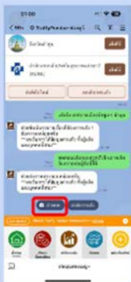
4 กดปุ่ม ถ่ายภาพ แล้วกดส่ง