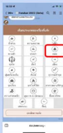
5 กดเลือก ประเภทเรื่อง รอสักระยะบจะส่งการ์ดการแจ้งให้ (หากต้องการแจ้งอีกครั้ง กดปุ่มแจ้งเรื่องใหม่ )