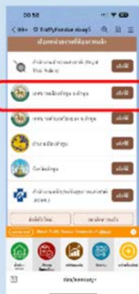
2 เลือกหน่วยงาน แล้ว กดปุ่ม แจ้งที่นี่